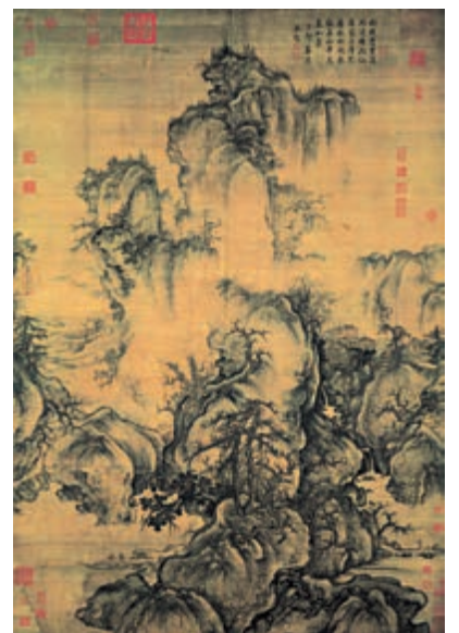
▲宋代畫家郭熙《早春圖》

卻充滿着懷疑的精神，想要重新解釋儒家經典，超越漢朝董仲舒以來「天人感應」的一套說法，建立更具宇宙性的體系。宋學以儒學內容為主，同時吸取了佛學和道家思想，是在唐代儒、佛、道融合滲透的基礎上，孕育和發展起來的一種新的學術思想。理學思潮的興起，標誌着唐代以來儒、佛、道鼎立的多元文化格局的終結。不論是「漢學」抑或「宋學」，宋代美術研究的方法與對象，一方面從深度和廣度上幫助人們認識這個時期藝術的「經典性」。南宋末年，理學被奉為正宗思想，成為中國社會後期思想文化的主導，滲透於政治、社會、文化各方面，影響深遠。