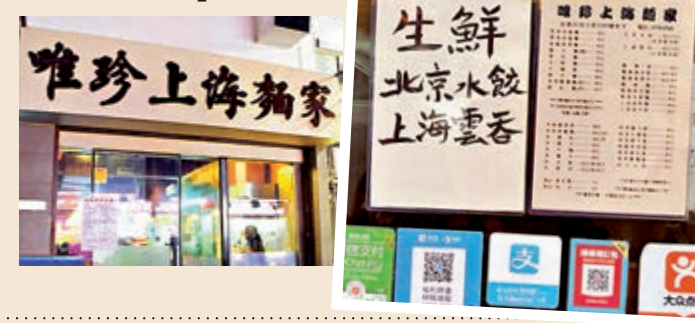
▼油麻地唯珍上海麵家貼出所謂「警告」，聲稱不招待中國旅客，市民揶揄「黃毒上腦病人膏肓」