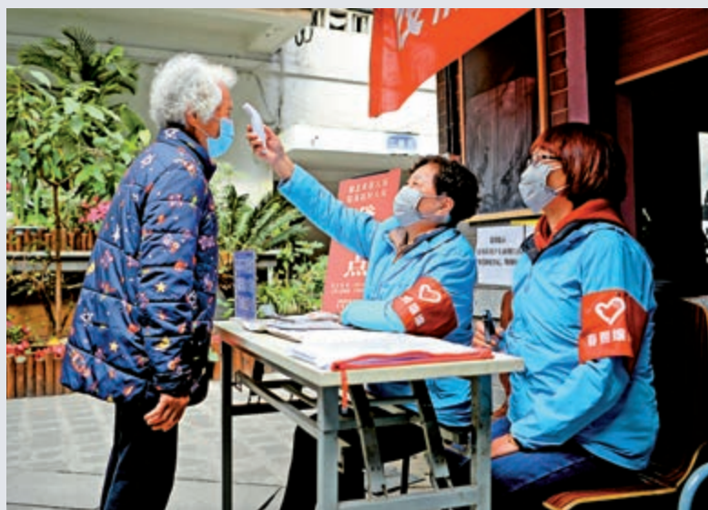
▲成都市錦江區總府路社區志願者為外出回來的居民測體溫