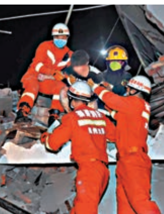
▲消防人員成功救出被困者 網絡圖片