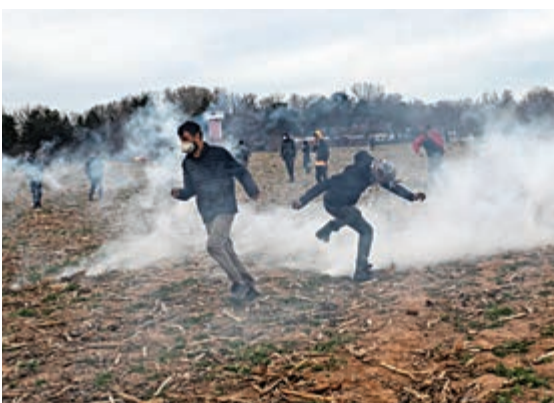
▲希臘邊境軍警6日施放催淚煙驅散難民

【大公報訊】綜合法新社、新華社報道：土耳其與希臘接壤邊境危機升級，已有約2萬難民來到土希邊界，希臘警方與難民和非法移民再次發生衝突，同時土耳其對希臘警方釋放催淚煙，被轟動難民入境。