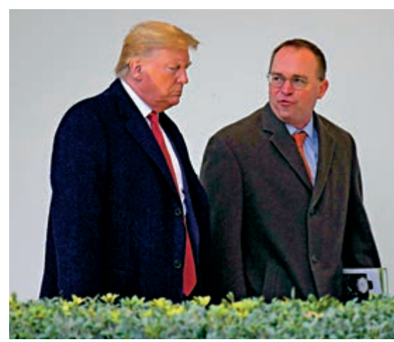
▲美國總統特朗普（左）聽馬爾瓦尼匯報工作

據報道，特朗普與馬爾瓦尼的關係在後者進入白宮後不久就開始惡化。去年10月彈劾調查中，馬爾瓦尼承認特朗普扣起對烏克蘭近4億美元軍事援助，又指特朗普想要對方調查一家烏克蘭公司是否干預2016年美國大選，成為第一名「泄密」的華府官員。雖然馬爾瓦尼之後發聲明否認