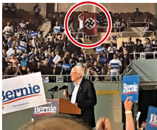
▲桑德斯5日在亞利桑那州出席競選集會，一名男子揮舞納粹旗幟