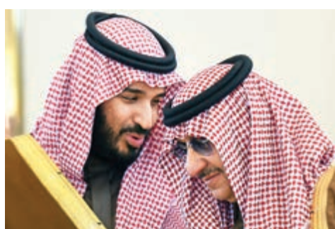
▲沙特王儲本·薩勒曼與艾哈邁德親王（右）交談

艾哈邁德親王是被拘留的最高級別王室成員，是沙特國王薩勒曼的親弟弟。他被認作爭奪王位的最佳人選之一，曾於2017年公開反對兄長將