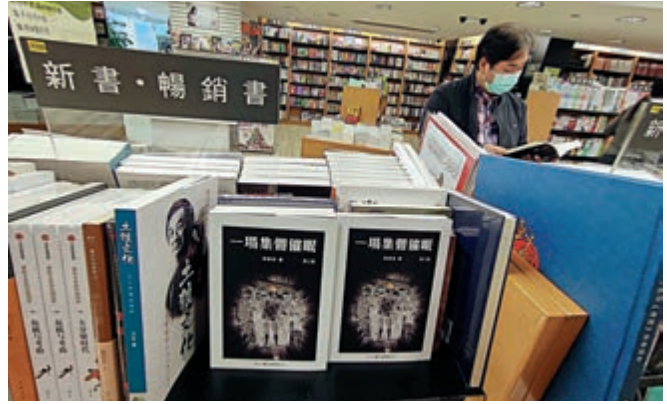
▲《一場集體催眠》正在香港三聯書店、商務印書館、中華書局、SuperBookcity.com全線熱銷中

《一場集體催眠》一書現正在香港三聯書店、商務印書館、中華書局、SuperBookcity.com全線上架銷售。