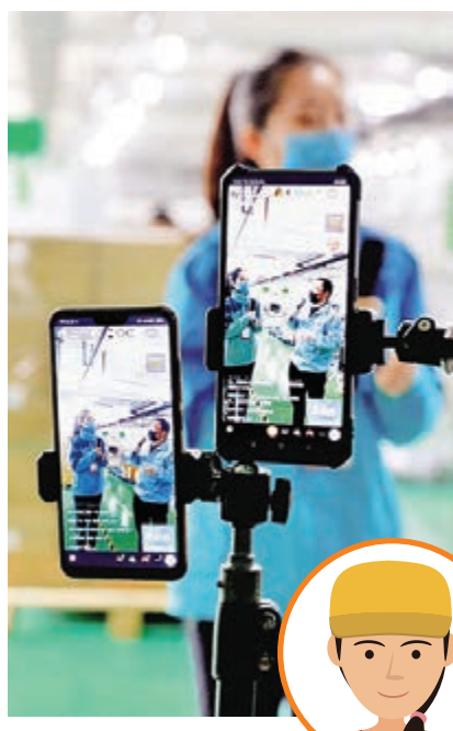
▲四川省「網上春風行動」走進企業，通過直播平台向網絡求職者介紹企業情況

「今年以來我們已舉行逾百場『雲端雙選會』，規模遠超線下。」線上獵頭智聯招聘的負責人告訴大公報，得益於「雲招聘」模式，企業可借助「線上電子簽約系統」完成求職者錄用簽約操作，學生亦能在「雲端」與心儀企業進行實時諮詢、面試。