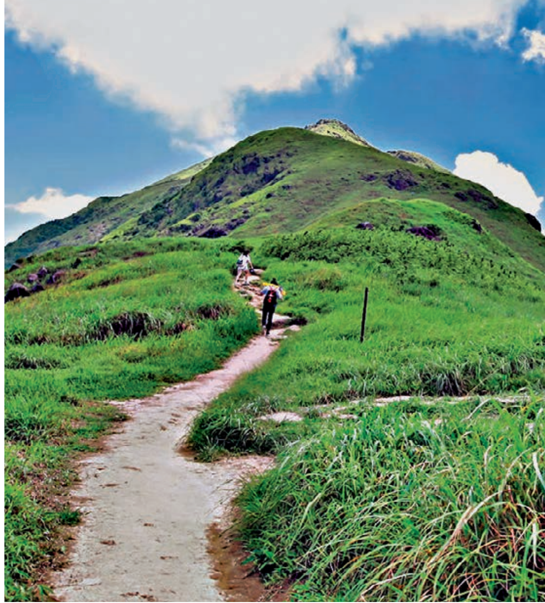
▲鳳凰山位於大嶼山