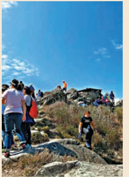
▲香港第二高峰鳳凰山

此行的尾聲，就是參觀昂坪市集了。市集中有不少特色小店，展示文化、美食及土特產，遊客川流不息，可以買一些手信贈送親朋戚友，獨樂樂不如眾樂樂！