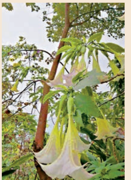
▲香港四大毒草之一蔓陀羅，只看不碰