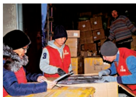
▲絲路城外籍員工在海外倉整理貨物