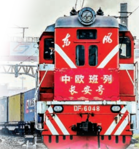
▲中歐班列穩定運行成為中國與「一帶一路」沿線國家經貿往來的一大支撐 資料圖片