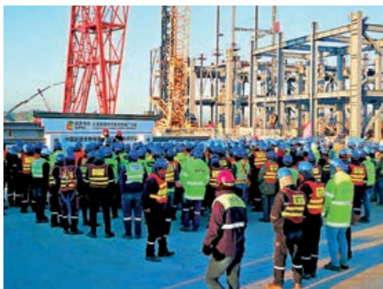
▲土耳其胡努特魯煤電廠項目施工現場

胡努特魯煤電廠廠方傑坦言，疫情發生後面對的最大困難是「缺人」。為了嚴防人員流動帶來的感染，因春節回國休人員暫緩返回土耳其，國內參建單位施工人員暫緩派駐土耳其施工現場，施工現場人員「不進不出」。