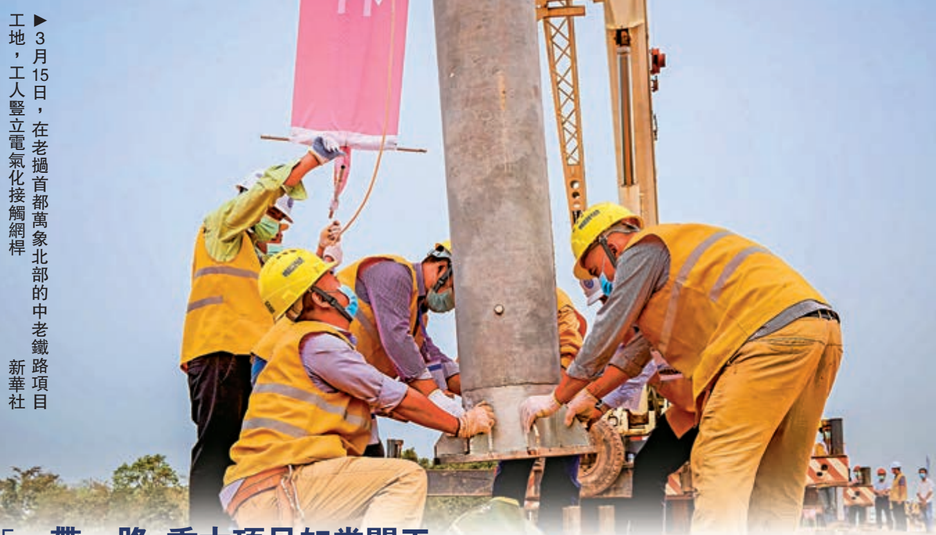
「一帶一路」重大項目如常開工