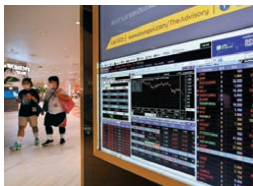
▲泰國股市採用T+2交收制度，在沽出股票後第二日收到資金

另泰國股市與本港股市一樣，也是採取T+2的交收制度，即買賣後兩日才進行交收，假設星期五