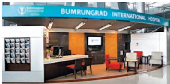
▲泰國積極發展醫療旅遊。為方便海外顧客，康民醫院會在國際機場設立辦事處