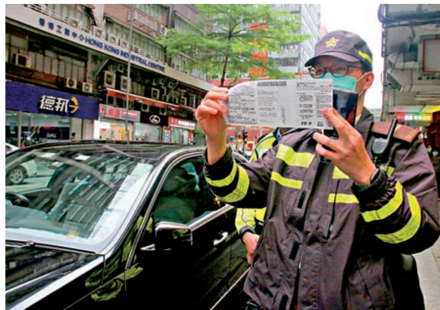
▲警方本周開始試行以電子告票方式票控違泊車輛