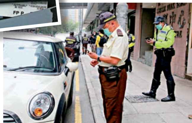
▲警方西九龍總區已發出近千張電子告票