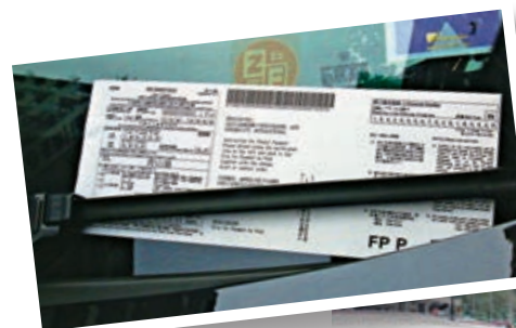
▲「電子牛肉乾」昨日經大雨「洗禮」後，字樣仍然清晰

有關器材用電量是足夠一日使用，一卷紙大約可打印約90張告票；運輸署將於新的行車證陸續加入二維碼（QR CODE），到時只要一「嘟」就可列印電子告票，過程快速方便。