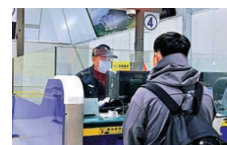
▲旅客通過港珠澳大橋珠海口岸入境需經過「三道關」。

口岸海關檢疫、邊檢篩查、分類安置「三道關」核驗無誤後可放行；如果在口岸被識別出為重點防控對象，則要實施居家隔離或集中隔離14天。