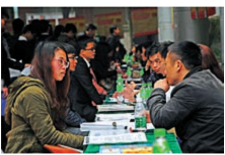
▲受疫情影響，應屆畢業大學生就業形勢不容樂觀。

受新冠肺炎影響，校園春季招聘會和企業宣講會紛紛延期或取消，應屆大學生迎來史上最難畢業季。廣東省內高校就業人數達49.3萬人，目前全省應屆畢業生簽約率僅14.6%。對此，團廣東省委、省學聯聯合發起「展翅計劃，戰疫行動」，在由港區全國政協委員黃英豪、吳傑莊推動成立的易展翹平台上，開展公益線上春季招聘活動。