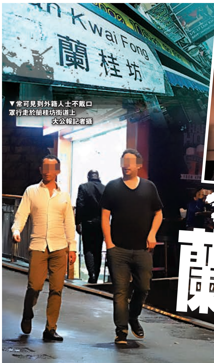
▼常可見外籍人士不戴口罩 單行走於蘭桂坊街道上