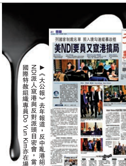
《大公報》去年報道，反中亂港組織NDI派人竄港與反對派頭目密會，當時國際特赦組織專員Do Yun Kim亦在場

原文「The Amnesty International SCA will give pupils the chance to become human rights activists」國際特赦組織將引導學生成為爭取人權分子