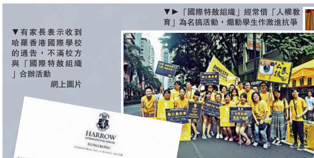
「國際特赦組織」經常借「人權教育」為名搞活動，煽動學生作激進抗爭

有家長擔心，學校與如此政治化的組織合辦活動是否恰當。教育局表示，已向有關學校了解事件，據悉校方已即時作出跟進處理。局方會繼續與學校緊密聯絡，提供專業意見及支援，又指若學校發現任何學習活動不利學生成長發展，應立即停止或勸喻學生不要參與。