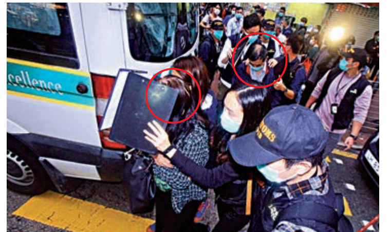
▲海關昨日拘捕涉事兩夫婦（紅圈示），並將他們押往位於北河街的找換店搜證

去年九月暴亂期間，有律政司檢控官被指在Facebook留言，教示威者一旦被捕，「記住唔好講唔好簽任何文件直到律師來」，被質疑是教人逃避調查，該檢控官最終被調職。