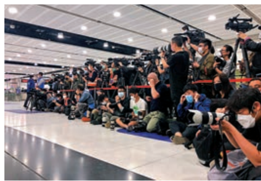
▲是次參與採訪的記者都須經過預先登記及認證