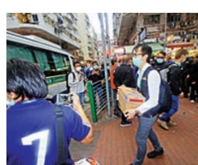
▲海關取走證物，作進一步調查

【大公報訊】記者黃慶輝報導：在深水埗、長沙灣及旺角經營7間找換店的東主夫婦疑「走數」千萬，日前（18日）向警方自首後，已獲准保釋候查。但隨即因涉嫌違反《打擊洗錢及恐怖分子資金籌集條例》及無牌經營深水埗一間找換店被海關拘捕，兩夫婦被押往位於北河街的找換店搜證，關員在行動中檢走大批文件。