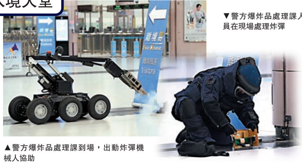
▼警方爆炸品處理課人員在現場處理炸彈