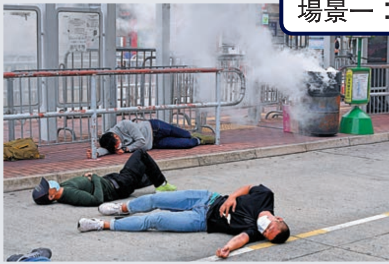
▲警方模擬恐怖分子在小巴士站的垃圾桶放置遙控炸彈，當巡邏警員行近時引爆，多個在小巴士站等候的市民受傷倒地