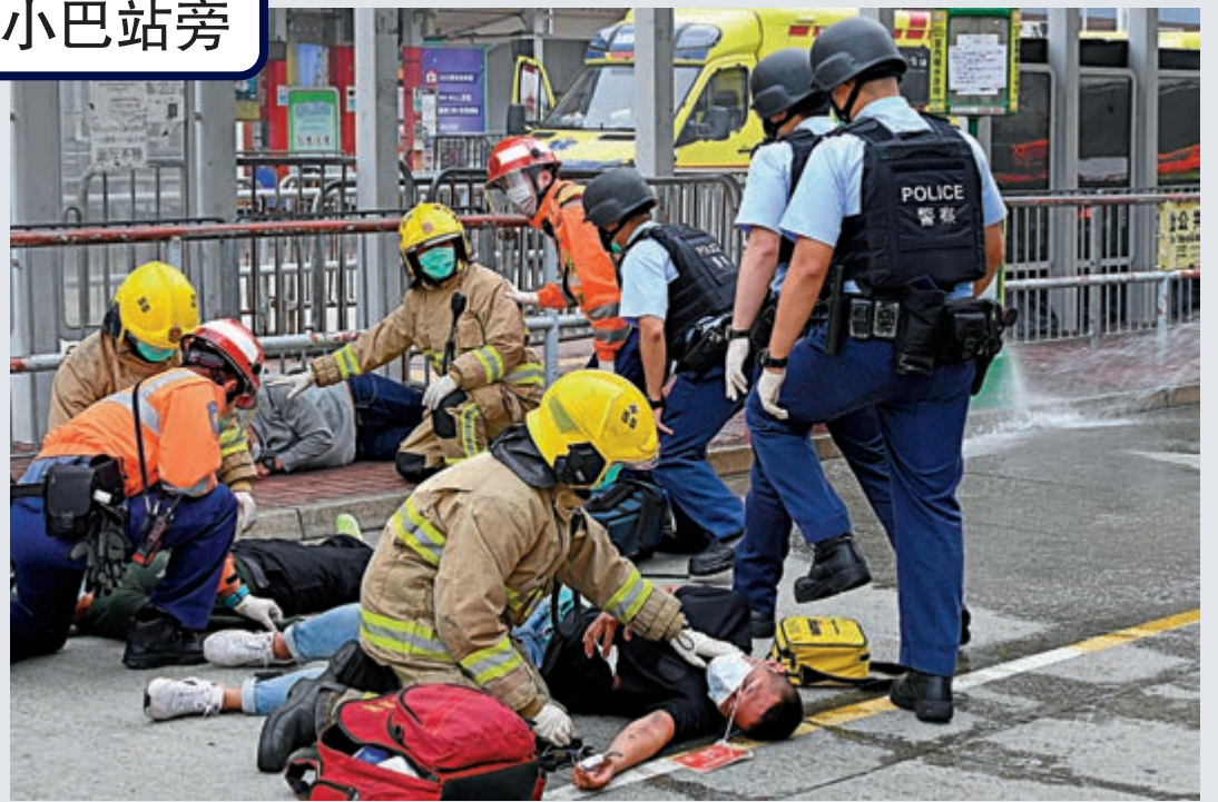
▶部分警員和消防員一起為傷者急救，另外有警員在附近搜索其他爆炸品