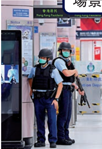
▲警方模擬在管制站離境大堂發現可疑物品，手持長槍身穿避彈衣的衝鋒隊員到場增援