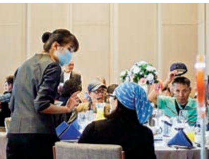
▲台北一家餐廳員工戴上口罩接待客人，降低飛沫傳染風險。

另據記者會介紹，2月下旬，多位台灣知名人士發起《救別類，應物無傷——為對抗歧視、社會和諧提出呼籲》連署活動，迄今參與人數已逾千人。