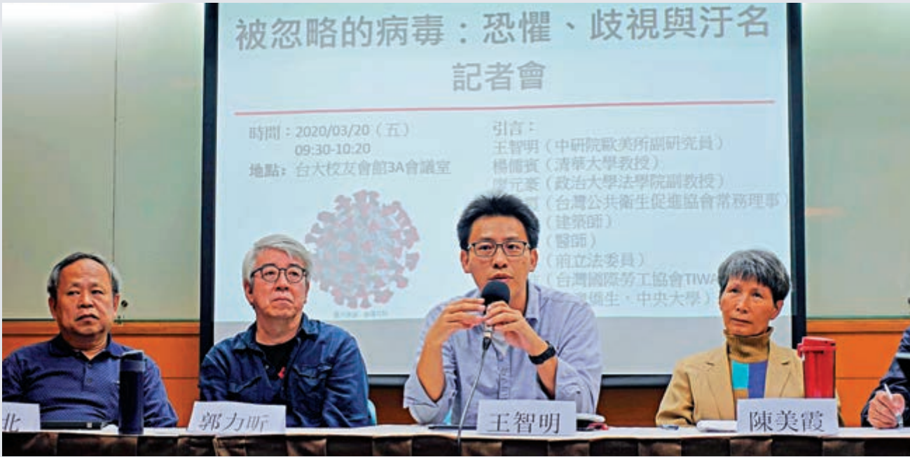
▲台灣學界20日在台北召開記者會，批評民進黨當局借疫情進行政治操弄、煽動「反中」情緒。

嚴震生直言，應該要標準一致。如果（民進黨當局之前）態度謹慎，島內不會確診案例這麼快破百。