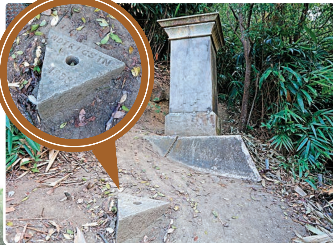
▲天文台最早的子午線南標記石柱位處天文台中星儀以南11354呎，即灣仔寶雲道一帶，石柱附近有一個三角標石(圖圖)，寫上1893，相信是設立的年份