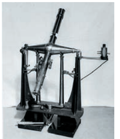
▲香港天文台早期使用的中星儀

返回的路線也有不同，最簡單的方法是從原路回到寶雲道健身徑，較另一邊來得容易。遊人還可以到附近姻緣石朝聖，若以最快速度回到市區，沿登山之路折返藍屋即可。這個行山路線老少咸宜，最後要提醒的是：石碑隱身在叢林陰暗之處，要想拍得好照片，宜在陽光充足時到達。