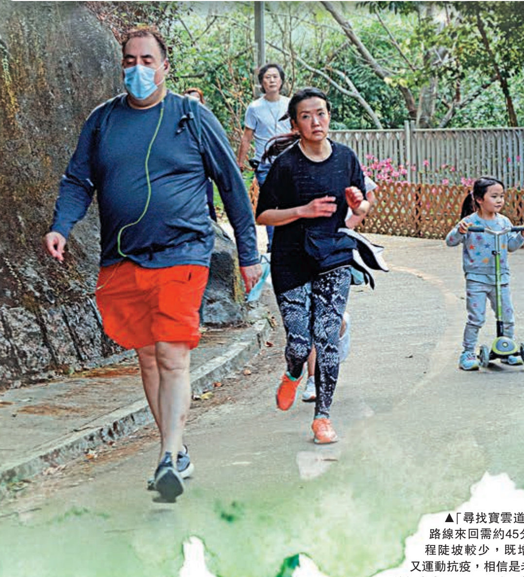
▲「尋找寶雲道子午線」路線來回需約45分鐘，路程陡坡較少，既增長知識又運動抗疫，相信是老少咸宜的好去處