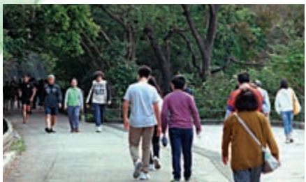
▲不少天文愛好者在寶雲道尋覓天文台於今年初公布的子午線南標記石柱