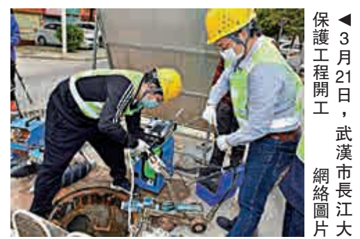
▲3月21日，武漢市長江大保護工程開工。網絡圖片