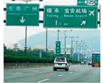
▲廣東高速公路通車總里程保持全國首位，圖為被譽為「珠三角黃金通道」的廣深高速。

備受關注的深圳至中山跨江通道今年要完成投資59億元；而深中通道深圳側連線今年完成投資5億元，計劃與深中通道全線於2024年一併建成啟用。而長深高速惠鹽深圳段改擴建工程投資27.3億元，將於明年完工。