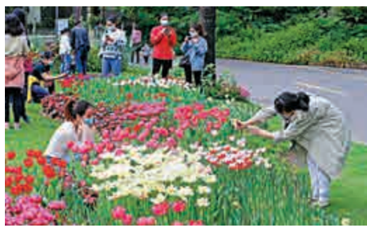
▲深圳仙湖植物園為全國醫務工作者免費入園。

據了解，深圳市仙湖植物園也將於3月24日正式恢復開放，每日入園人數限2000人，並對全國的醫務工作者免費開放至今年年底。