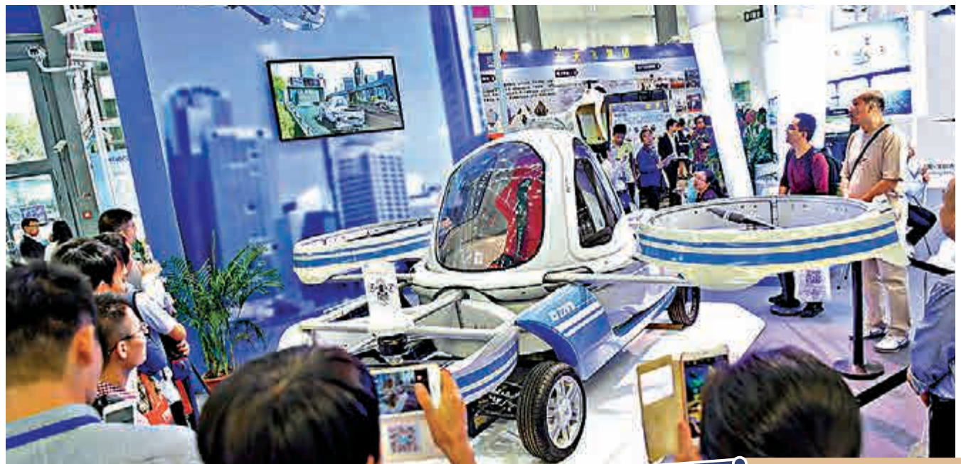
廣深高速擴建後將有利於香港融入「廣深港澳科創走廊」，圖為深圳高交會上展示的「會飛」的汽車。

「改擴建後的廣深高速賦予新定位：『國家高速公路網和大灣區大通道』功能與城市內部交通功能並重，不同路段各有側重，為「複合型大通道」。廣東省發改委有關負責人表示，隨着大灣區建設步伐的加快，廣深高速對大灣區內聯外通的重要性日益凸顯。它連同廣深沿江高速、珠三環高速東段、廣深鐵路、穗莞深城際、廣深港高鐵路等複合型的交通通道，將對集中於穗莞深港的創新資源進行立體支撐，而香港亦更便捷地融入「廣深港澳科創走廊」建設，與穗莞深連成一個產業聯動、空間連接、功能貫穿的創新經濟帶。