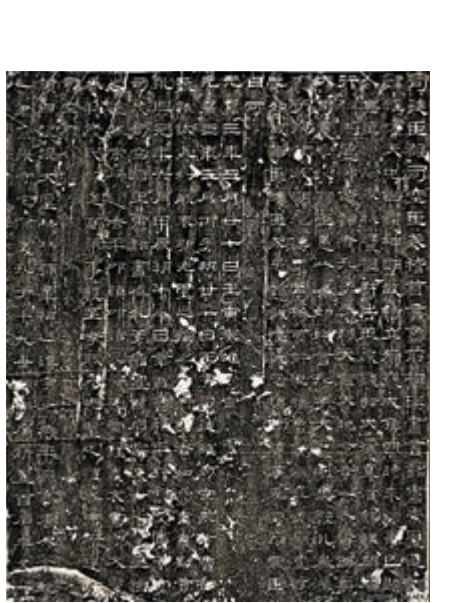
▲清宮舊藏《漢乙瑛碑》軸 台北故宮博物院