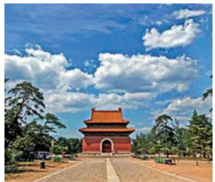
▲清西陵主陵雍正帝泰陵大碑樓環境