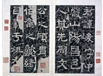
▲北宋拓本東漢《魯峻碑》 故宮博物院