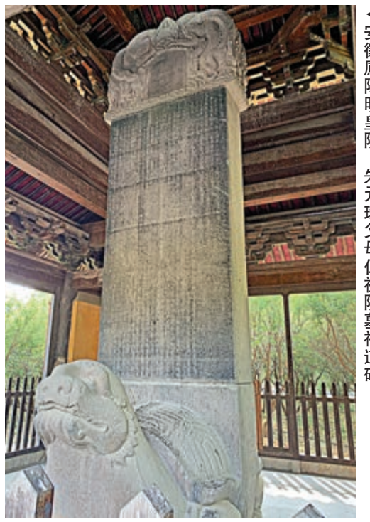
▲安徽鳳陽明皇陵，朱元璋父母仁祖陵墓神道碑