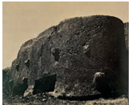
▲南京陽山明孝陵神功聖德碑未運走之超大石材（一九八〇年代舊照）