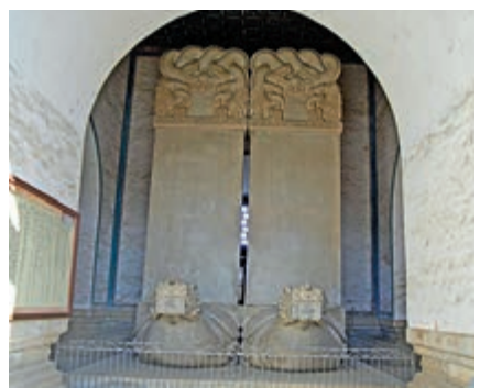
▲清西陵雍正帝泰陵大碑樓內神功聖德碑