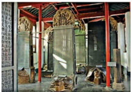
▲西安碑林始建於北宋，收藏漢代至今碑石、墓誌四千多件