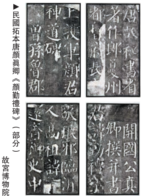
▲民國拓本唐顏真卿《顏勤禮碑》（部分） 故宮博物院