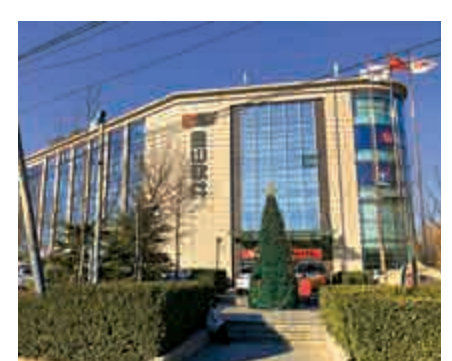
▲金山軟件指，疫情對各業務有正面提升作用 資料圖片