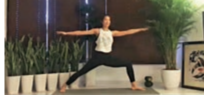
▲江旻德希望大家在家時仍然保持運動