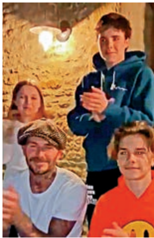
▲碧咸（左下）與家人為英國醫護人員鼓掌

英球壇亦對碧咸一呼百應，像利物浦領隊高洛普、球員羅拔圖法明奴、李斯特城射手占美華迪、曼聯中堅哈利馬古尼、熱刺中場艾歷迪亞等等都響應活動。溫布萊球場外也特別亮起藍燈，並打出感謝醫護字眼。