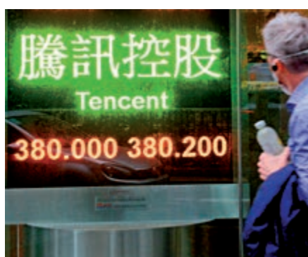
▲騰訊昨收報380.2元，今年第一季升1%，是兩隻錄得升幅的藍籌股之一

，恒安國際(01044)時隔多年後，再度登上藍籌股王位置，股價在首季漲5%，跑贏騰訊(00700)一個馬鼻位置。同樣被視為在疫情下，業務有增無減的騰訊，股價在首季累升1%，是表現最佳的藍籌股。