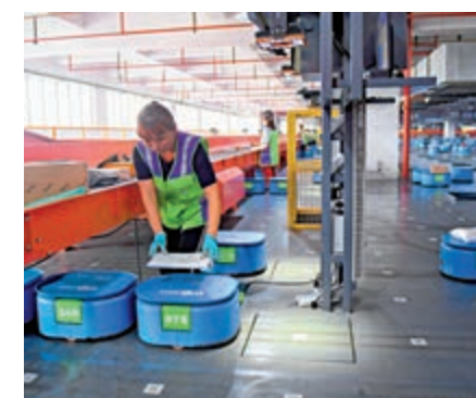
▲若阿里成功入股韻達，將可進一步增強阿里菜鳥智能物流網絡