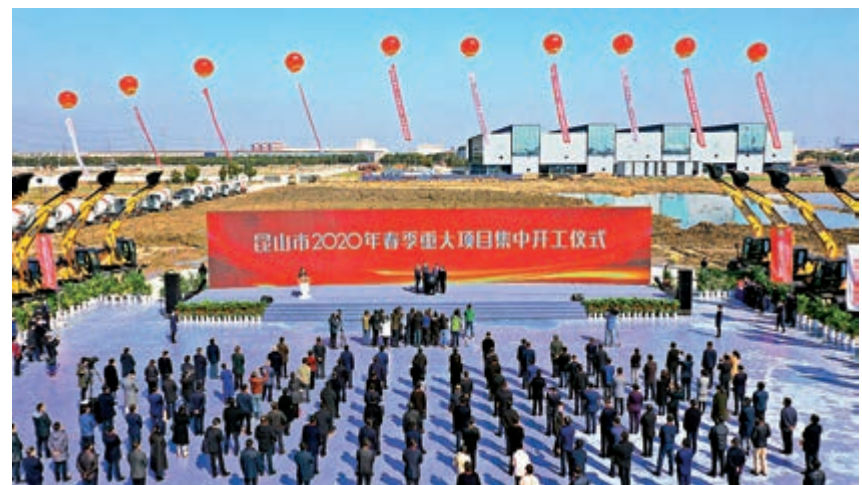
▲ 昆山全力拼經濟，圖為該市一批重大項目集中開工