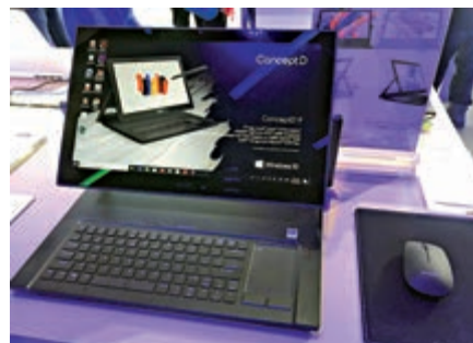
▲ 在昆山設有產線的仁寶電腦是全球筆電生產龍頭