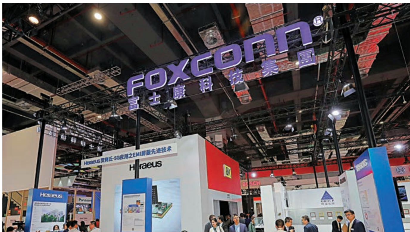
▲ 富士康決定將50億海外訂單轉移到旗下的富翔精密工業（昆山）有限公司生產