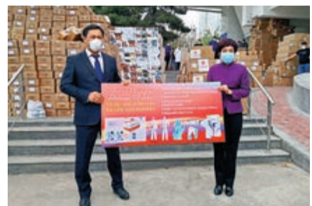
▲ 3月30日，中國政府援助烏茲別克斯坦防疫物資順利交接

30日，王毅應約分別同葡萄牙國務部長兼外長席爾瓦、盧森堡外交大臣阿塞爾博恩通電話。王毅表示，新冠肺