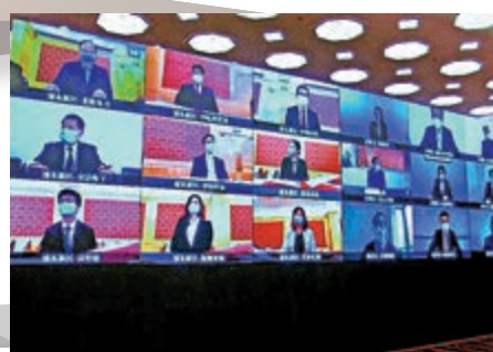
▲ 3月31日，一場雲簽約在上海展覽中心舉行，涉及152個項目共4836億港元

外資追加對華投入並不令人意外。畢馬威中國首席經濟學家康勇指出，隨着疫情逐漸得到控制，市場情緒回歸平穩，此前被壓制的消費、投資需求亦將釋放，中國經濟長期發展趨勢不會因疫情而改變。