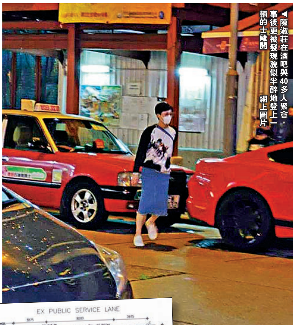
陳淑莊在酒吧與40多人聚會，事後更被發現貌似半醉地登上一輛的士離開。

對於陳淑莊以立法會議員作為「擋箭牌」，政府發言人指出，立法會並非法定團體或政府諮詢機構，議員在議會以外其他場合參與或組織群組聚集，不管是否屬於立法會的職能，亦不屬獲豁免的群組聚集。發言人強調，政府立法禁止群組聚集，是為了降低傳播病毒的風險，人多聚集的聚會是高危活動，對參與者生命與健康造成威脅，也對其他市民的生命與健康構成風險，活動主辦者亦有可能需要承擔相關法律責任，包括刑事責任。