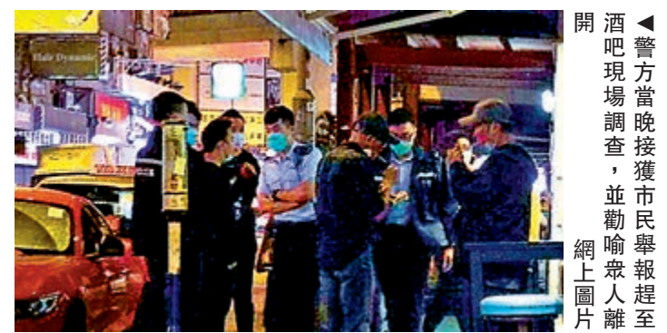
警方當晚接獲市民舉報趕至酒吧現場調查，並勸喻眾人離開。