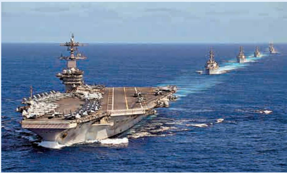
▲美「羅斯福」號3月15日在中國南海軍演

儘管此次「羅斯福」號事件引發軒然大波，美國國防部並沒有更加公開透明的意向。國防部長埃斯珀表示，美軍要修改新冠肺炎疫情信息發布政策，美國國防部發言人也表示，軍方要保護關於疫情是否會影響美軍戰略威懾能力和應戰能力的信息。 美國目前有11艘航母，其中五艘在船廠進行長期維修，兩艘在美國港口等待部署，還有兩艘部署中東，剩下兩艘在亞太地區。但現在「羅斯福」號被病毒「擊沉」，未來一個月可能都會困在關島，另一艘停泊在日本橫須賀基地的「里根」號則在進行中期維修，且也出現兩海軍確診個案，暫時抽不出身。《外交政策》指出，美國已趕緊將正在波斯灣部署的「杜魯門」號航母打擊群派往亞太，急於填補在南海暫時出現的「航母真空」，防止力量均勢向中國傾斜。