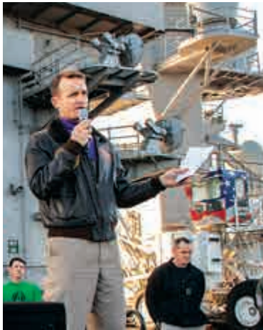
◀美「羅斯福」號前艦長克羅澤爾

「羅斯福」號航母打擊群自今年1月在印太地區部署以來十分高調，它在3月5日至10日不顧疫情訪問越南峴港，這是美國航母自2018年歷史性訪越以來再度來訪，旨在加強美越軍事聯繫，籠絡越南的反華鷹派政客。此後「羅斯福」號航母又在15日闖入中國南海進行軍演，打着「航行自由」的幌子「秀肌肉」。 但在全球疫情蔓延的陰雲下，這艘航母3月24日首次出現確診病例，美國國防部雖然同意它前往關島泊岸，但未同意4000多名官兵下船隔離。由於航母內部空間狹窄，一個睡覺區域就有60到150個通鋪，病毒迅速蔓延，直到3月30日已有93人感染。艦長克羅澤爾當天發郵件向高層求救，呼籲「不要在和平年代讓士兵白白犧牲」，郵件翌日被媒體曝光後引爆輿論，海軍部不得不同意讓海軍分批下船隔離。截至4日，已有155宗人確診，逾1500人被轉移上岸，進度僅為海軍原本撤離計劃的57%。