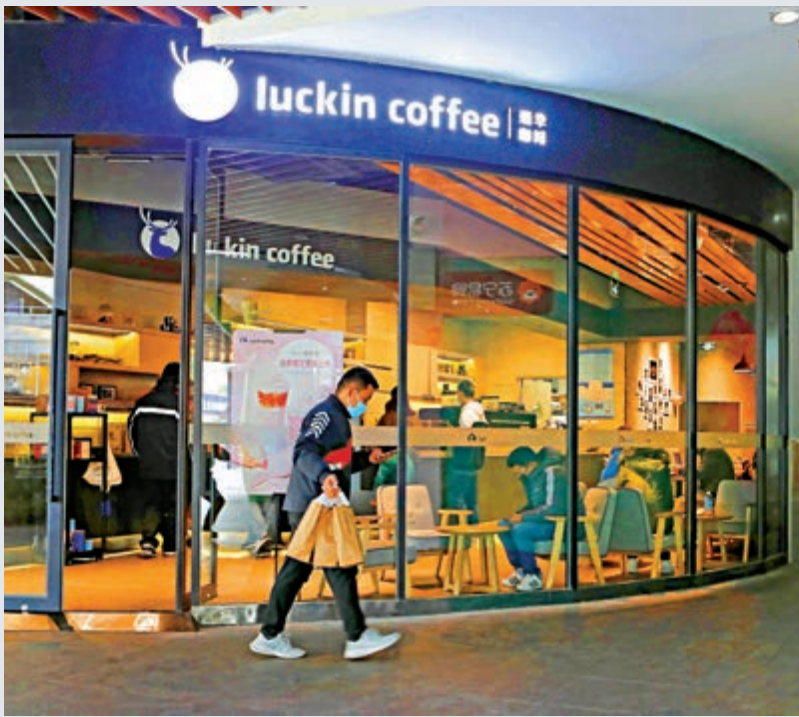
▲瑞幸咖啡盤前升10%，其後宣布停牌，待披露重要消息

值得注意的是，在渾水公司發表沽空報告後，曾參與瑞幸2018年12月B輪2億人民幣融資的投行中金公司，曾發表名為《瑞幸咖啡：匿名沽空指控缺乏有效證據》的研究，稱該沽空報告立論基於非專業的草根調查和主觀推斷，缺乏有效證據，並繼續看好瑞幸。