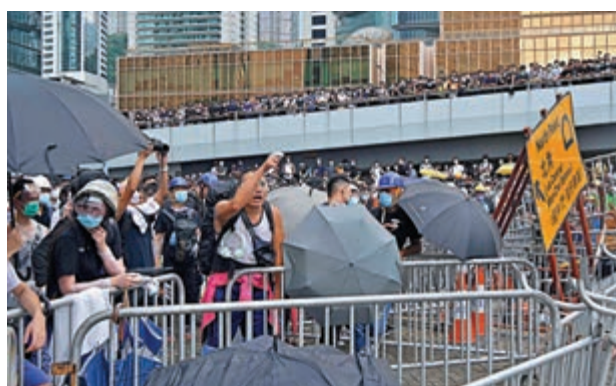
▲警方透露自去年6月9日爆發的暴亂至今今年2月29日，共拘捕7613人

因多次有暴徒以嚴重暴力，甚至致命方式襲擊警員，警方在處理有關大型騷亂期間，曾使用19發實彈、1491樽胡椒噴劑。另外，警方曾出動人群管理特別用途車（俗稱水炮車）共65日次，以去年11月出動19日次最頻密；出動銳武裝甲車則有68日次。