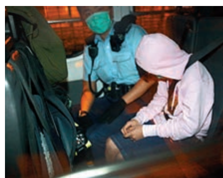
▲五名童黨在大角咀攔途截劫一名婦人，登上的士逃走

刀劫去司機財物及車輛，交通警於大埔進行追截時開槍擊中車身，終擒獲四人，暫控行劫、無牌駕駛等四罪。