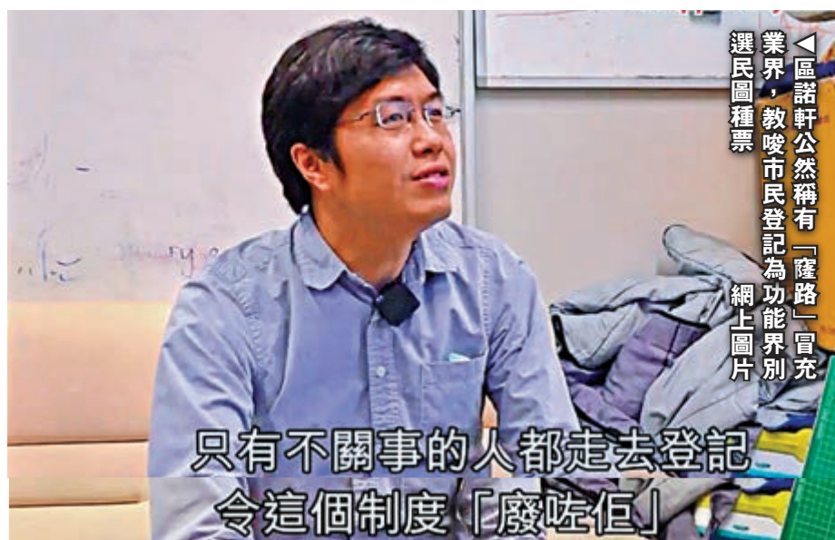
只有不關事的人都走去登記 令這個制度「廢咗佢」

選舉事務處強調，一直按法定程序處理和審核每宗選民登記或更改登記資料申請，以確保申請者或選民符合法例所訂明的登記資格，如發現可疑個案，會轉交執法部門處理。