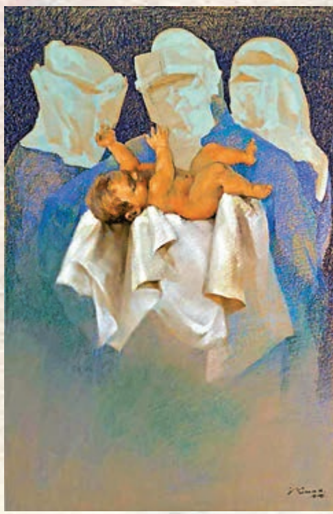
▲廖井梅粉彩《守護天使——生命永續》

林天行以畫荷著稱，他即以作品《聖荷》獻給前線醫護人員，感謝他們的辛勤付出，「畫中，我採用了中國畫傳統的『留白』