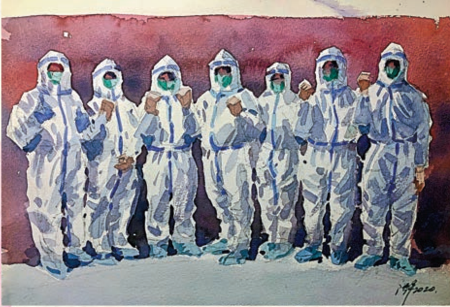
▲沈平水彩作品《众志成城》