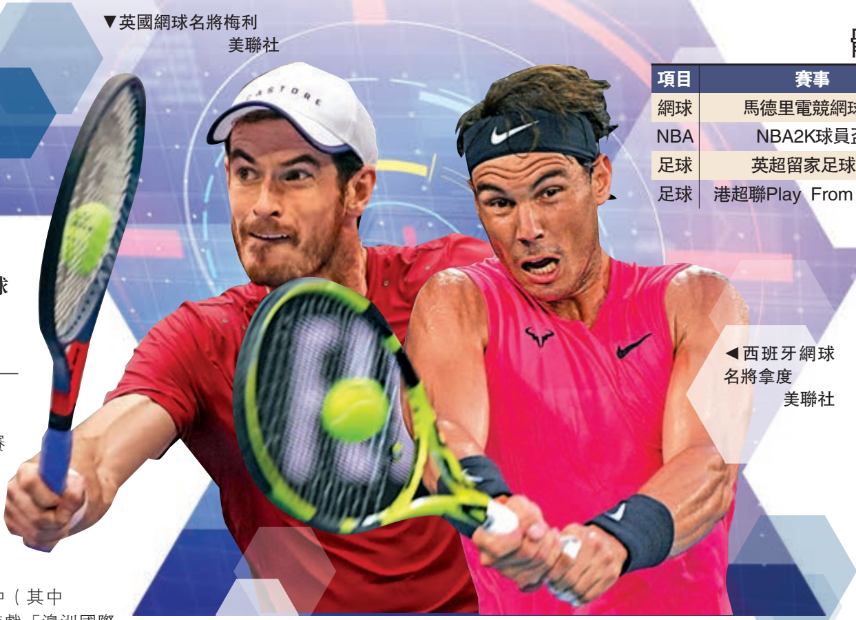
▼英國網球名將梅利