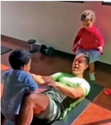
▲C朗（下）被兒子馬迪奧打擾 視頻截圖

【大公報訊】綜合ESPN FC、每日郵報報道：現年35歲的祖雲達斯球星C朗拿度仍是足球壇最出色球員，他在網絡上同樣擁有難以估計的商業價值，雖然他近日因沒有足球賽而很少在公眾面前露面，