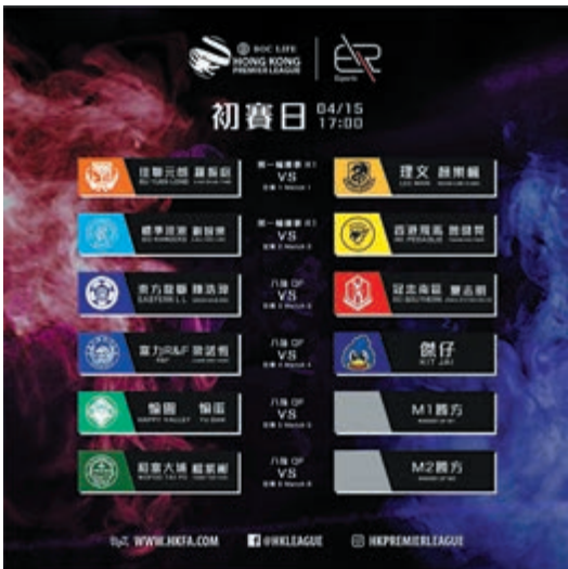
▲港超電競賽今午開鑼 足總圖片