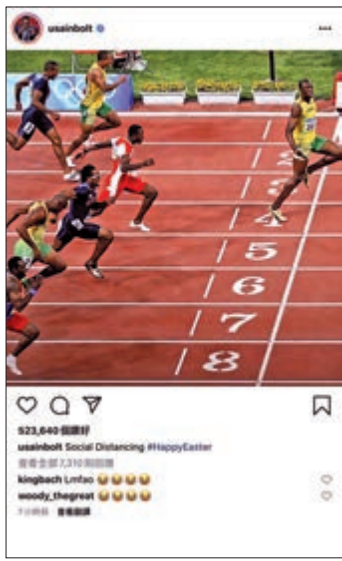
▲保特（右）當年在奧運輕鬆掄元

【大公報訊】曾奪得八面奧運會金牌的田徑名宿牙買加「閃電」保特，向來活躍網絡並貫徹他「寸爆」的性格。近日疫情流行，各界均呼籲民眾保持安全社交距離。保特在Instagram及推特貼上一張昔日奪金的比賽照片，並以「保持社交距離」為題，其幽默行為獲得68萬個讚好。