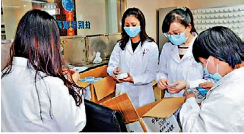
▲甘肅省中醫醫院醫生為「甘肅方劑」貼標籤