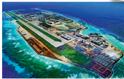
▲南沙區管轄南沙群島島礁及其海域，南沙區人民政府駐永暑礁

西沙區與南沙區的設立也使三沙市告別了「直筒子市」的時代。至此，中國僅剩下四個「直筒子市」：甘肅省嘉峪關市、廣東省東莞市、廣東省中山市、海南省儋州市。「直筒子市」通常級別是地級市，但不設（市轄區）區、也不轄縣和縣級市。這些「市」一般由縣級市升格而來，它的下一級行政建制是街道、鄉、鎮。