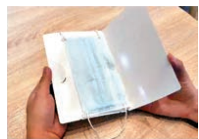
▲力嘉國際的口罩護套設計體貼用家

經多番修改，這款「護罩神器」按照醫用口罩大小設計，比A4紙對折後小一點，攜帶方便。產品經