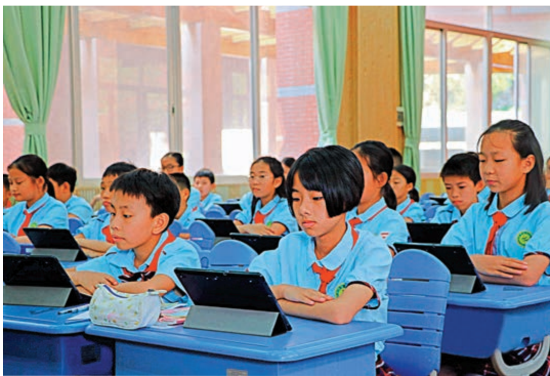
▲廣州11區最近陸續公布港澳子弟班入學政策。圖為廣州一所學校學生正在上課

記者了解到，廣州部分區域雖然無專門開設港澳子弟班，但也統籌安排港澳居民隨遷子女入學。從化區招生文件顯示，今年，持有港澳居民居住證滿一年的港澳居民（監護人）隨遷子女（或持證的適齡少年兒童），參照從化區來穗人員隨遷子女積分入學辦法統籌安排起始年級學位。