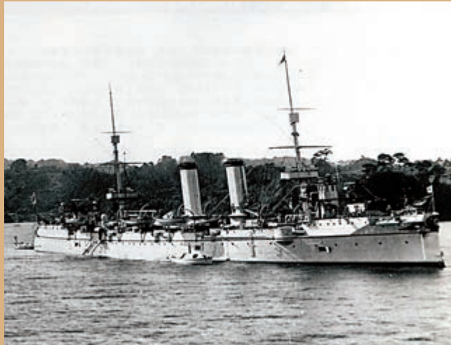
甲午海戰中，日本艦隊第一主力戰艦「吉野號」

日本明治維新後飛速發展，國力猛增，對外擴張的野心也急劇膨脹，暗暗制定了以侵佔中國為核心的「大陸政策」。其「大陸政策」的第一步是佔領當時中國的藩屬朝鮮，進攻中國東北。為取得進攻中國大陸的跳板和橋頭堡，日