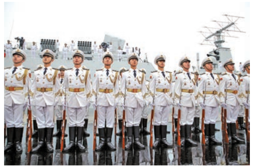
2019年4月23日，中國人民解放軍海軍儀仗隊在慶祝人民海軍成立70周年海上閱兵活動上，列隊接受檢閱