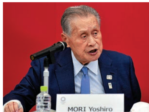
▲森喜朗是東京奧組委主席

巴赫當時還表示，奧運推遲帶來的額外支出將達數億美元，並說國際奧委會無為奧運延期投保。顯然，這筆巨額資金的來源肯定成為各方頭痛的問題。