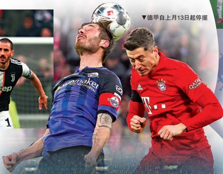
▼德甲自上月13日起停擺

另外，20間意甲球會一致同意必須盡可能完成球季。之前包括布雷西亞等幾間球會曾反對復賽，但現在發表聯合聲明表達共識，前提是獲得政府許可。