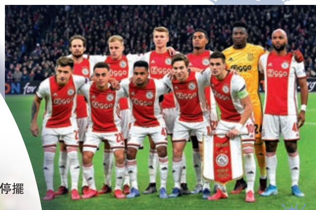
▼阿積士暫居荷甲聯賽榜榜首