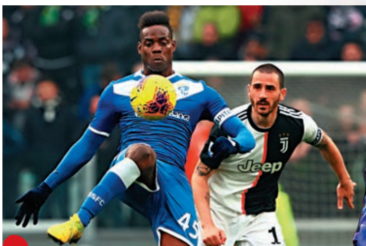
▲意甲球會同意盡可能完季

【大公報訊】綜合法新社、timeslive報道：「餓波」已近個半月的球迷終於看見曙光，德國足球聯盟今天再與德甲和德乙共36間球會開會，極有可能宣布德甲將於下月9日恢復比賽，成為歐洲五大聯賽以至全歐洲（除白俄羅斯外）首個重開的聯賽，所有比賽則會閉門進行。