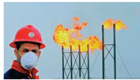
▲已有國家開始減產石油，科威特和阿爾及利亞表示正在減產，比「油組+」減產時間更早

交易員和經紀商現時仍然對本周初油價破天荒的表現猶有餘悸，最少有四家經紀行，包括INTL FCStone Financial和Marex Spectron，正在限制客人參與交投最活躍的期油新交易，以盡量減低損失。東京證券交易所警告投資者，部分與石油有關產品，現正經歷極度波動市況。