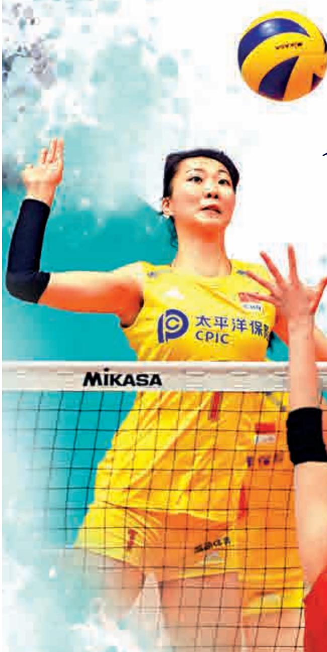
◀袁心玥(左) 身高超過兩米

東京奧運周期，中國女排「第一高度」袁心玥，從一名年輕球員成長為球隊副攻線上的中堅力量。如果說朱婷奠定了中國女排的實力基礎，那麼袁心玥則決定着中國女排未來可能上升的高度，她是中國女排實力提升的關鍵人物。