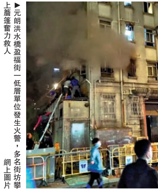
上簷篷奮力救人 元朗洪水橋盈福街一低層單位發生火警，多名街坊攀上簷篷奮力救人