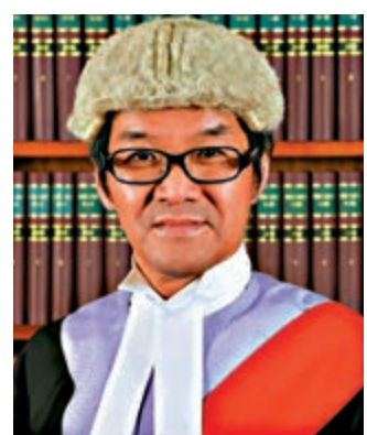
▲區院法官郭偉健批評暴徒亂港，卻遭反對派大肆抹黑

【大公報訊】記者高仁、郝壽報導：區院法官郭偉健前日就一宗男導遊傷人案頒判詞時批評暴徒亂港，昨日卻遭反對派黃之鋒、張崑陽等在網上大肆抹黑，包括在圖片中以綠色塗污郭官面容，並煽動網民投訴郭官以向其施壓等。律政司表示，發布誹謗法庭或司法人員的言論，有可能觸犯藐視法庭罪。多名法律界人士批評反對派輸打贏要，企圖以政治干預司法，最終目的在於破壞政府管治。