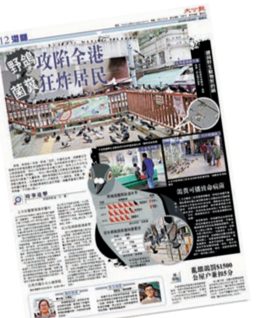
▲《大公報》去年四月二十六日曾專題報導，揭露火警天橋衛生情況惡劣，過百隻白鴿聚集，而有問題至今仍未解決

【大公報訊】記者李斯哲、高仁報導：北角英皇道與糖水道交界對開行人天橋昨日早上近七時忽然起火，警方將案件列縱火處理。此前職工聯盟擬於五月一日在港島區舉行公眾遊行，警方24日宣布禁止及反對。香港法學交流基金會副主席、執業大律師丁煌昨日接受訪問時表示，網上傳聞五月一日將會有大規模的暴亂發生，北角發生的縱火案，不謀而合地成為五月一日事件的前奏。