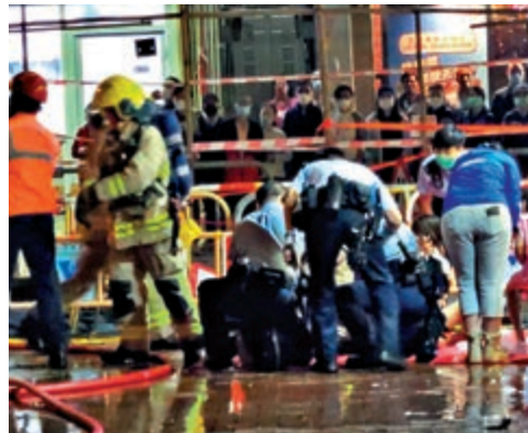
▲火警釀成一名男嬰死亡，消防員及警員到場施救

【大公報訊】記者黃慶輝報導：元朗洪水橋翠珊園一個低層單位昨晨發生火警，火勢猛烈，屋內有多人被困火場，他們在窗邊向樓下大喊救命。多名街坊見情況危急，即手持鐵筆等工具，借木梯攀上簷篷，用剪鉗剪開火單位窗花奮力救人。消防員接報到場，證實火警中有一家五口受傷，包括父母及三名幼童，其中一名一歲男嬰送院搶救後證實不治。消息指，火警前有人在家中煮食，消防正調查起火原因。