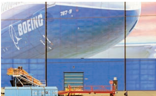
波音首季僅交付了50架飛機，去年同期則交付了149架飛機

777及behemoth 777X機型的產量，以及計劃削減10%的員工。外電報道，波音737 Max預計將繼續停飛直至8月，目前公司仍在解決相關的軟件問題，有可能會在秋季爭取復飛。 波音公司行政總裁Dave Calhoun不久前表示，與今年早些時候押注於航空業會持續增長的投資者來說想像的不同，航空需求旅行恐需要在兩三年內才能恢復至去年的水準。 空巴首季蝕40億 另外，歐洲空中巴士昨日公布，首季錄得淨虧損4.81億歐元（約40.49億港元），差於去年同期的4000萬歐元純利，營業額亦大幅下跌一成半，至106.3億歐元，較市場估計的106.5億歐元差。同時，較多人注視的除息稅前經季性調整盈利，則大跌了四成九，至2.81億歐元。 空巴形容，目前的危機，是其認知中最嚴峻的一次。流動資金方面，空巴錄得負80.3億歐元現金流，其中包括早前已公布的36億歐元破紀錄罰款。