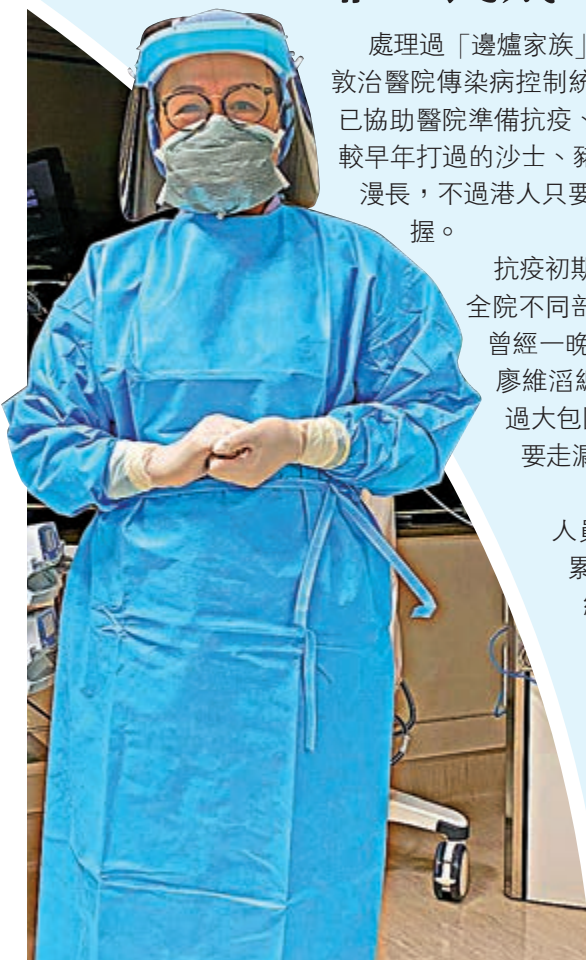
▲李姑娘負責在深切治療病房照顧新冠肺炎病人