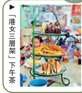
▶「港女三層架」下午茶

走得差不多，就想搵嘢食醫肚。一九五四年開業的麥生記冰室，在梅窩無人不知，裝潢懷舊，相對乾淨整潔，牆上貼着許多老香港相片和小朋友的畫作，可見是一間家庭式經營的人情味小店。店內除了一般茶記食物，還有「瀕臨絕種」滾水蛋、忌廉講鮮奶、公司三文治供應，更有「港女三層架」下午茶：有港式西餅、雜果沙律、炸薯條、咖喱角等小食，連三杯飲品，份量足夠三人食。