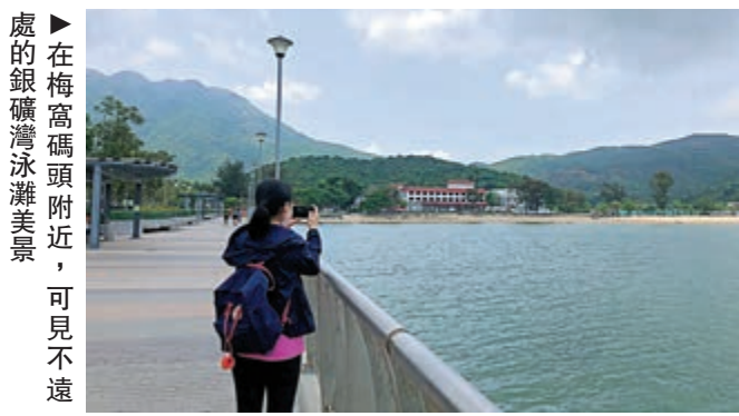
在梅窩碼頭附近，可見不遠處的銀礦灣泳灘美景。