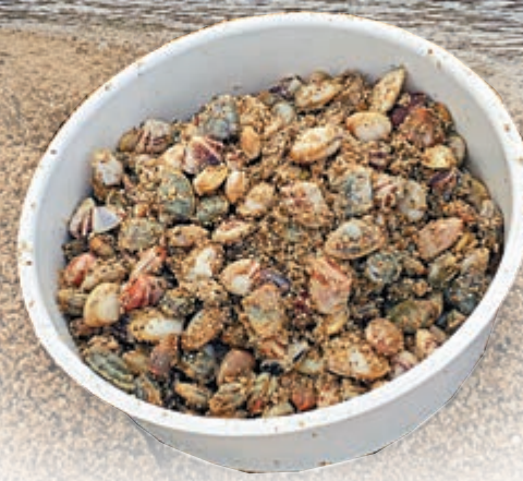
▲摸蜆莫「大小通吃」，避免破壞生態