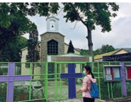
▲中華基督教會梅窩堂