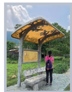
▲涼亭造型可愛，酷似動畫片《龍貓》場景

最後，我們回到梅窩碼頭，再次見到這個淳樸漁村的另一面，卻有麥當勞、7-Eleven、Starbucks、惠康等連鎖店舖，覺得不真實。遊人逃離市區來離島吐一口悶氣，但對於鄉民而言，這些不過是日常。可謂慣看花開花落，潮漲潮退。