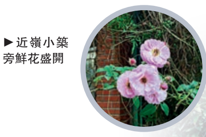
▶近嶺小築旁鮮花盛開