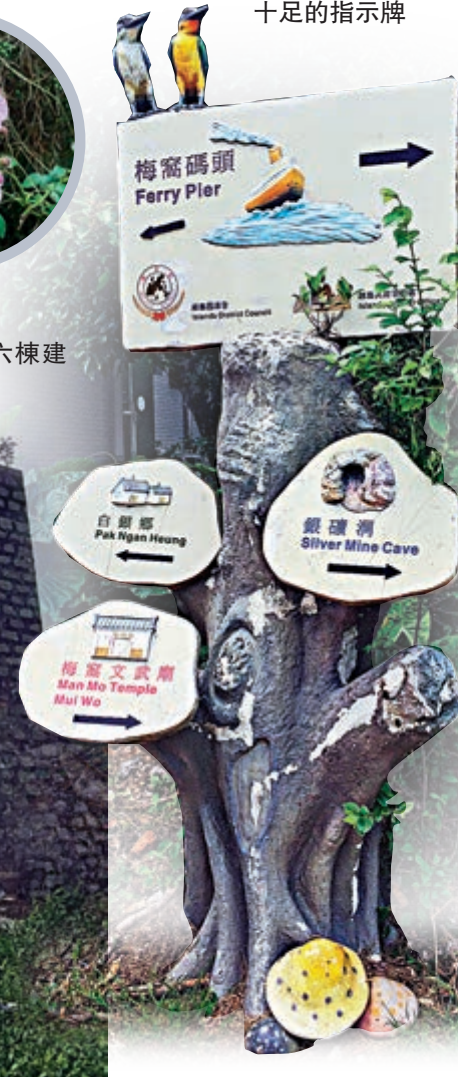
白銀鄉 Pak Ngan Hoang

疫情下，來梅窩行山鍛煉以增強免疫力，是不少人的選擇。由漁農自然護理署和離島區議會合作籌劃的「離島自然歷史徑」，把大嶼山及坪洲豐富的生態、多元化的地貌和眾多的特色景點串聯起來，推廣以自然為本的旅遊活動。該徑全長35公里，分為四段，包括坪洲段、梅窩段、昂坪段及大澳段。遊客可選擇乘坐渡輪、纜車或遠足，前去體驗多彩多姿、充滿生趣的獨特風貌。 「離島自然歷史徑——梅窩段」全長約7公里，沿途設立解說牌，透過細說白芒村、梅窩等具歷史價值的地點，介紹沿途自然美景，讓遊人一邊輕鬆漫步，一邊體驗歷史和自然共融的風貌。 由梅窩起步至白芒，約需3小時，沿途多有林蔭。到達白芒後，可選擇轉乘巴士（嶼巴36線）繼續遊覽「離島自然歷史徑」東涌及大澳段的風光。