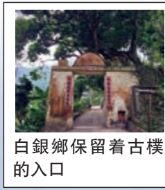
白銀鄉保留着古樸的入口