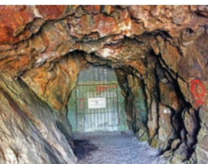
▲銀礦洞僅存十餘米開放