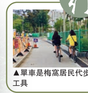
▲單車是梅窩居民代步工具

一步出梅窩碼頭，看到停泊區的單車陣，可知單車在梅窩有多普及。馬路上有單車標記，走着走着，不時有居民騎車從身邊經過，若非偶有巴士行駛，差點錯以為馬路就是單車徑。在梅窩，單車就是生活。徒步梅窩，路程不算遠，慢慢行是不錯的選擇，但騎車也是另一番滋味。