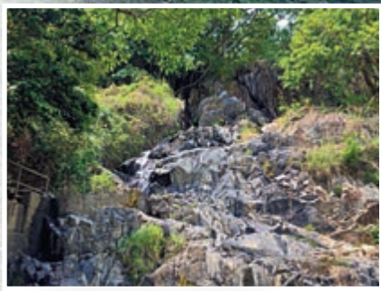
▲銀礦瀑布有少量流水