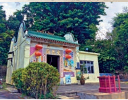
▲白銀鄉的文武廟已有四百年歷史