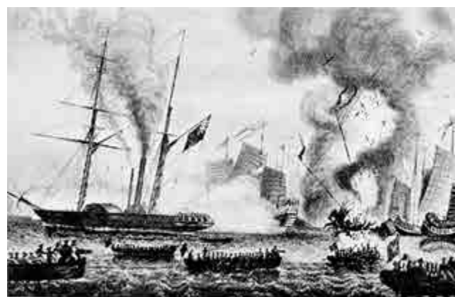
▲英國教科書對鴉片戰爭這一歷史事件隻字不提

【大公報訊】記者唐曉明報道：齋色園可立小學的一堂歪曲鴉片戰爭歷史的網課，揭示出香港歷史教育的荒謬。而類似的淡化或美化英國侵略這一事實，其實與英國人避而不談鴉片戰爭的做法是一致的。英國稱鴉片