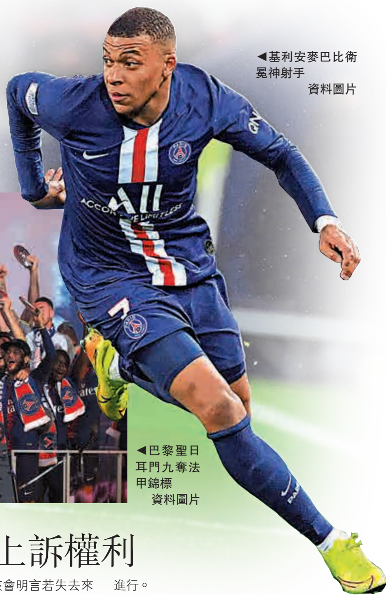
基利安麥巴比衛冕神射手 資料圖片