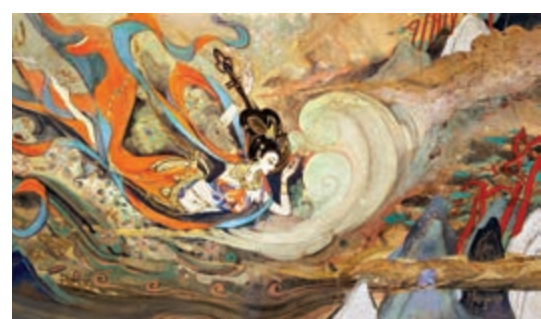
▲《王者榮耀》與敦煌研究院合作推出以敦煌「飛天」為靈感的皮膚

物的保護和傳播、文化價值的挖掘和梳理、文化IP的演繹和活化三個層面，變身為敦煌的「數字文保」，以期釋放出文化遺產更多的精神和文化價值。目前，騰訊還在與敦煌研究院探討利用計算機視覺技術與AI技術提高壁畫的修復、還原效率。