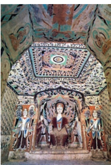
▲《太子出海尋珠記》的原型取自敦煌第296窟