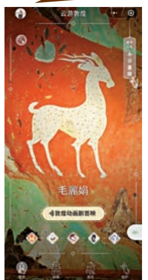
▲微信小程序「雲遊敦煌」上映的敦煌動畫劇