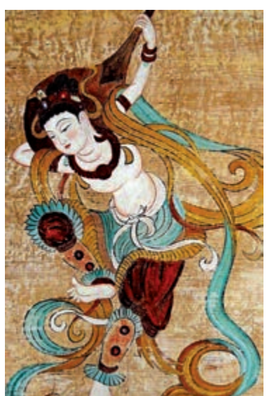
▲莫高窟112窟的反彈琵琶