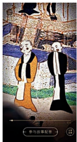
▲《太子出海尋珠記》取材於莫高窟「善事太子」

細細觀賞「雲遊敦煌」動畫劇會發現，動畫劇的顏色完全還原了壁畫的色彩，保留了原作的美感。「雲遊敦煌」動畫劇負責人表示，既要考慮到受眾的喜好，又要更加充分與真實地活化千年文化，難度係數還是比較高的，除了要關注傳統文化怎樣結合現代新場景、將敦煌文化實現「線上化」的呈現，還要特別注意細節的打磨與還原。