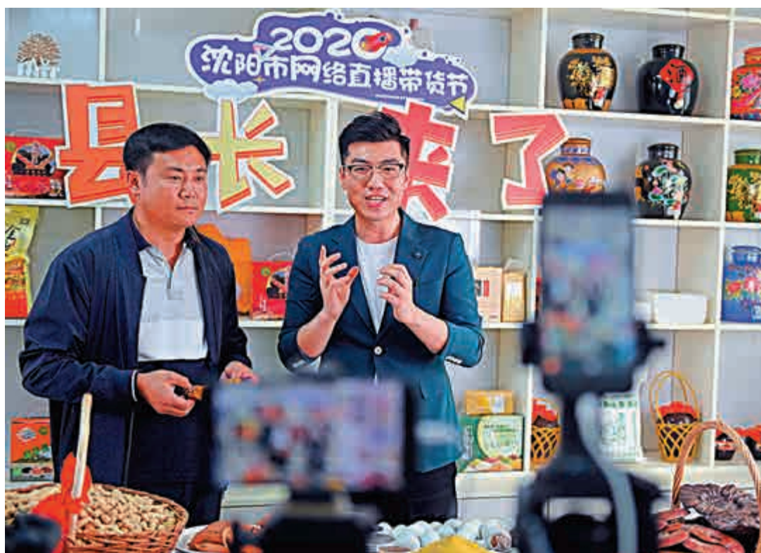
▲4月29日，2020瀋陽市網絡直播帶貨節「首秀」在遼寧省瀋陽市康平縣郝官屯鎮小塔子村民宿上演。圖為直播現場