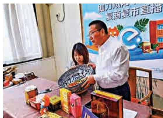
▲陝西咸陽市副市長王靖（右）介紹當地特色美食