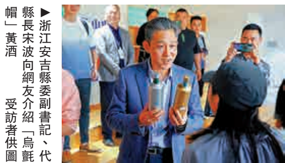
▲浙江安吉縣委副書記、代縣長宋波向網友介紹「烏氈帽」黃酒

記者了解到，當天活動共吸引該縣202家企業參加。據安吉縣商務局統計，本次活動預計可帶動線上銷售超過6億元（人民幣，下同），為企業注入寶貴的現金流。