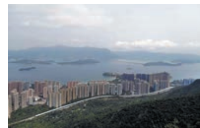
▲從馬鞍山眺望吐露港

順着半壁江山而行，幾次下落，就到了武林聖地。這裏是一個大峽谷加上一片平台，對面是密林森森的山峰。港產武打片常在此地取