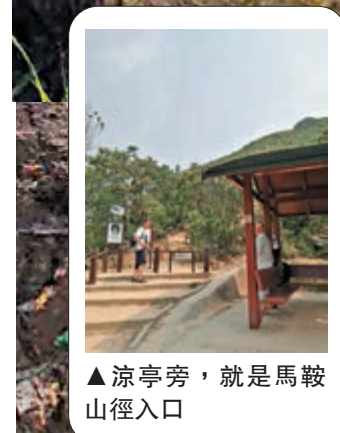
▲涼亭旁，就是馬鞍山徑入口