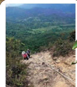
▲借助有心人提供的粗繩，攀上吊手岩就容易多了