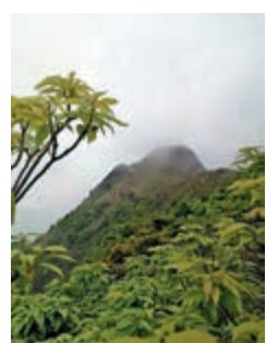
▲迷霧飄來，籠罩山峰