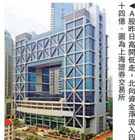
▲A股昨日高開低走，北向資金淨流入四十四億。圖為上海證券交易所

，更多的就是圍繞2900點區間指數震盪，建議關注低位潛力板塊，首選軍工；次選影視傳媒。