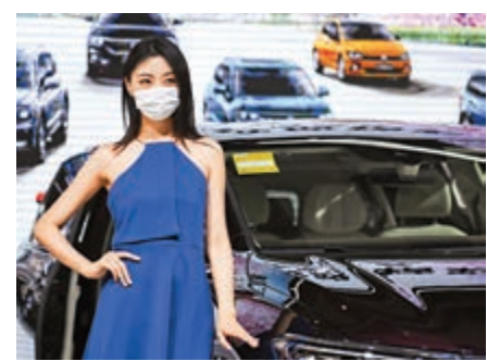
▲中國汽車行業產銷持續保持回暖趨勢。圖為上周在長沙舉行的2020湖南汽車展覽會一隅

4月，汽車產銷分別達到210.2萬輛和207萬輛，環比增長46.6%和43.5%，同比增長2.3%和4.4%；新能汽車產銷分別完成8.0萬輛和7.2萬輛，環比增長31.6%和9.7%，同比下降22.1%和26.5%。陳士華指出，汽車總體市場逐步恢復，一方面得益於防疫形勢向好和相關促消費政策推動；另一方面是受企業補庫存的拉動，截至目前