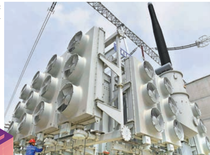
▶1000千伏特高壓變電站外觀