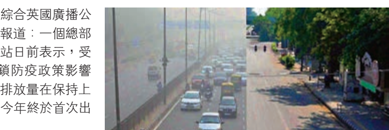
▲印度封城期間碳排減少，德里地區的霧霾也散去

【大公報訊】綜合英國廣播公司、《印度時報》報道：一個總部設在英國的環保網站日前表示，受3月開始的全國封鎖防疫政策影響，印度的二氧化碳排放量在保持上升趨勢近40年後，今年終於首次出現下跌。