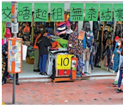
▲零售業遭暴亂與疫情夾擊，不少店舖已經結業

【大公報訊】評級機構標準普爾目前維持香港信用評級「AA+」，但指內地經濟下行，加上香港最近重燃的黑暴，將繼續衝擊零售行業，近日香港被下調評級的風險急劇上升，與區內其他地方一致。標準普爾主權與國際公共產業融資部副董事尹睿表示，港府動用財政儲備推出抗疫措施，或會進一步削弱未來信貸實力。