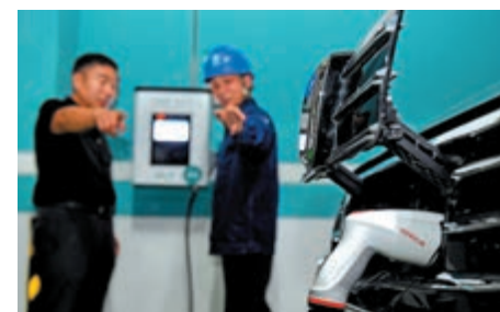
▲國家電網鄭州供電公司承建的新能源汽車充電樁

工信部於去年底發布《新能源汽车產業發展規劃(2021至2035)》徵求意見稿指出，計劃到2025年，新能源汽车銷量將佔全國新車銷量的25%，業界預計到2030年，中國的新能源汽車數量將達到6000萬輛以上。若要達到每部新能源汽车都平均有一部充電樁供電的比例，這代表充電樁的需求量仍然十分龐大，相關企業的前景樂觀。