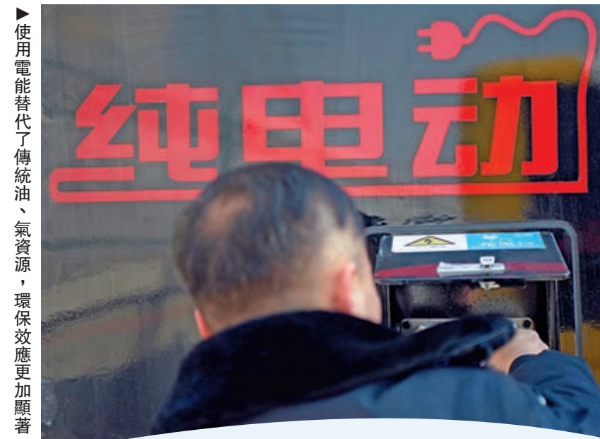
使用電能替代了傳統油、氣資源，環保效應更加顯著

充電樁能為列中國積極發展的新基建之一，原因絕不僅因為要發展新能源汽车，充電樁能與先進資訊技術融合、車企與互聯網平台互相配合運營，屆時整個充電網絡將更加數位化，有效降低用電成本，同時提升充電樁的使用率。螞蟻金服開始涉足這個市場，相信便是看到這個行業的發展潛力。