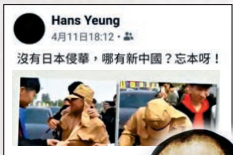
▲「沒有日本侵華，哪有新中國」的辱華帖文在日前流出，昨日文憑試歷史卷又爆出荒謬試題