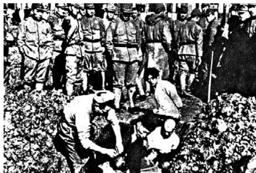
一九三七年十二月，日軍攻佔南京，屠殺了三十萬中國平民